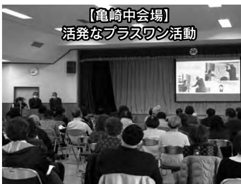
【亀崎中会場】 活発なプラスワン活動