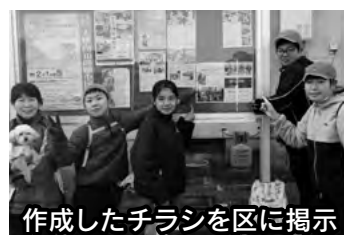
作成したチラシを区に掲示

『地域を基盤とした福祉教育プログラム』では、児童・生徒と地域が相互に変化をもたらすものが多くあります。今後とも『地域を基盤とした福祉教育』へのご理解とご協力をお願いします。より良い地域を児童・生徒とともにつくっていきましょう。