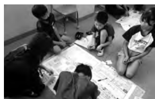
できることを考える