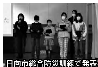
日向市総合防災訓練で発表