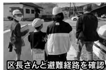
区長さんと避難経路を確認

幸脇地区の子どもたちが活動したことによって、地域の方々が災害時のことについて我がごととして捉えて、それぞれの「避難」について改めて考える機会となりました。